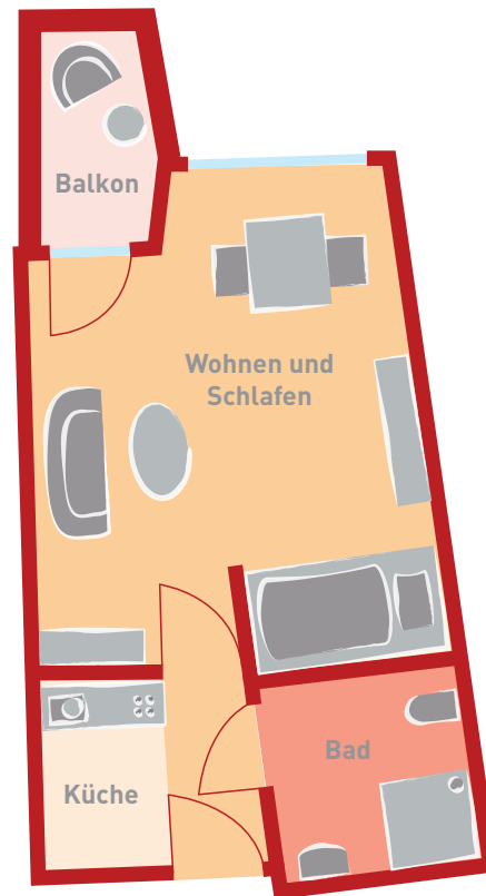
Beispiel für Einraum-Appartement ca. 33 qm